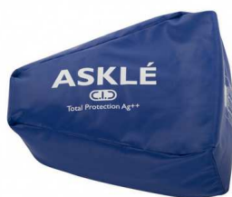
Cale de positionnement des hanches (35 cm x 28 cm) article 228