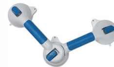
Barre d'appui FIT easy III Témoin sécurité couleur Longueur 49 cm article 9285