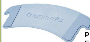
Planche de transfert Incurvée

Facilite et sécurise les transferts Dim. : 76 X 24.5 X 1.2 cm Max : 190 kg article 6177