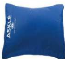
Base universelle T2 (56 cm x 40 cm) article 224