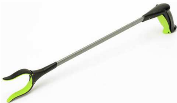
Pince préhension RevoReach Longueur 66 cm Poignée antidérapante Utilisation de tous les doigts article 8541