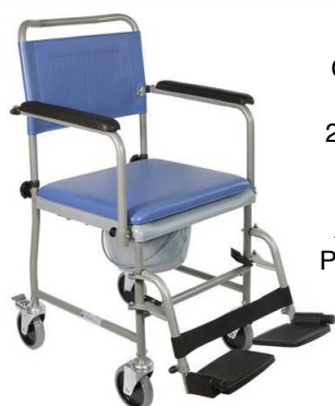
Chaise Garde-robe KELIS 4 roulettes pivotantes 2 roulettes arrière freinées Hauteur d'assise 52 cm Largeur assise 44 cm Accoudoirs escamotables Poids max utilisateur 130 kg article 9572