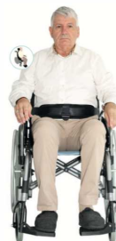
Ceinture éco abdominale article 9663

Tailles unique : Tour de taille : 50/145 cm Hauteur de la ceinture 11 cm