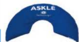
Demi bouée genoux (60 cm x 35 cm) article 225