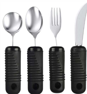
Couverts inox - Manches antidérapant Le couvert se tord pour trouver l'angle souhaité Petite cuillère : article 10479 Cuillère : article 10477 Fourchette : article 10478