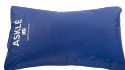
Base universelle T1 (37 cm x 26 cm) article 226