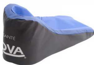
Coussin décharge talonnière de positionnement Alova taille 41 cm : article 1576 taille 45 cm : article 508