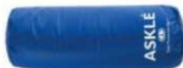
Base cylindre (60 cm x 21 cm diamètre) article 221