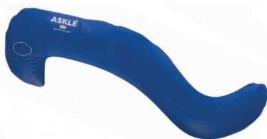
Cale de positionnement latéral décubitus Patient < 165 cm article 223 Patient > 165 cm article 799