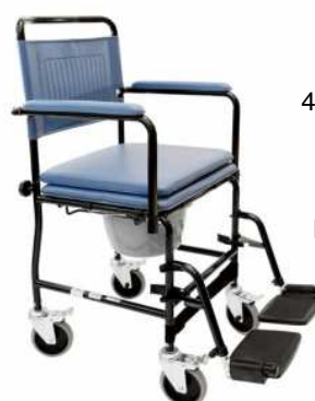
Chaise Garde-robe OCEAN 4 roulettes pivotantes freinées Hauteur d'assise 56 cm Largeur assise 44 cm Accoudoirs escamotables Poids max utilisateur 130 kg article 13219