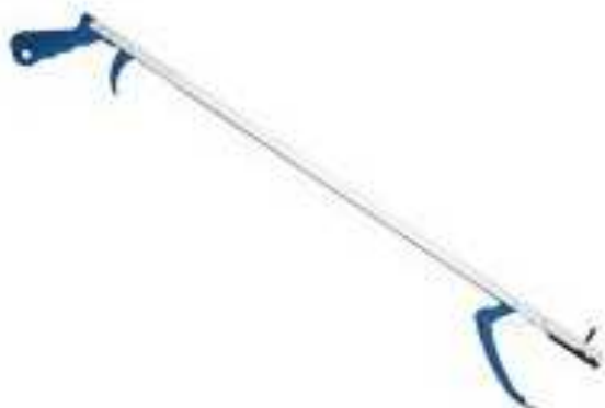
Pince préhension Nicky bleue Longueur 76 cm Bout équipé d'un aimant Utilisation à deux doigts article 3593