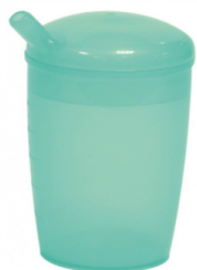
Verre à malade avec couvercle et pipette capacité 25 ml article 10475