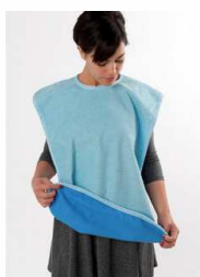
Bavoir premium 70x50 cm 100% coton imperméable Lavage machine 60° article 10482