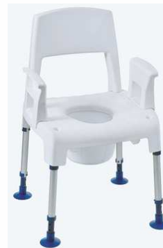
Chaise PICO-COMMODE Haut 42 à 58 - Max 160 kg article 1737