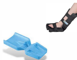
Talonnière enveloppante article 2514