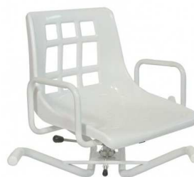
Siège de bain DAKARA Poids total 5.7 kg Hauteur dossier 34 cm Largeur assise 42 cm Largeur hors tout 72 cm Poids 130 kg article 13217