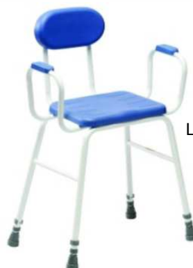
Chaise haute de cuisine Haut 52 cm à 67 cm Assise : Largeur 36 cm Largeur entre accoudoirs : 47 cm Poids 5,3 kg Structure acier renforcé Poids max : 172 kg article 6069