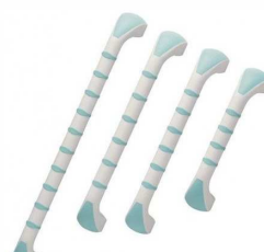
Barre d'appui Prima Très solide - plastique moulé Long 30-40-45-60 article 1104-1241-8495-1105