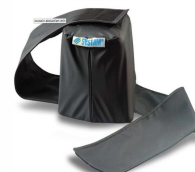
Plot abduction de hanche article 1382