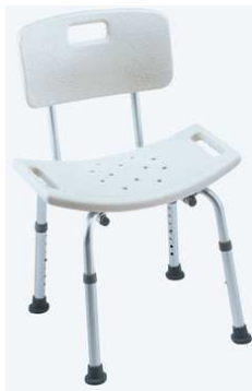
Chaise CADIZ Haut 40 à 50 - Max 143 kg article 11133