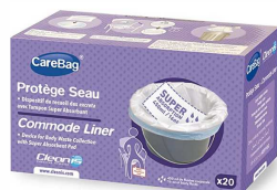
Protège seau Protège bassin article 346/3847