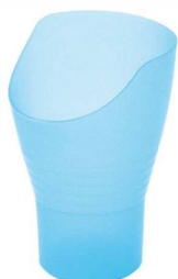
Gobelet découpe nasale capacité 27 ml micro-onde et lave vaisselle article 2062