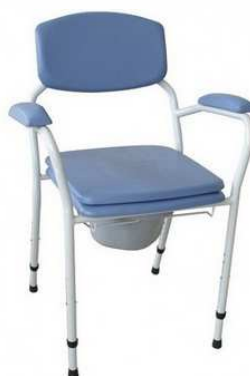
Chaise Garde-robe CANDY 200 Hauteur réglable : 44 à 62 cm Largeur assise 52 cm Accoudoirs confort fixes Sortie du seau par 4 côtés article 1239