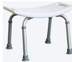
Tabouret PACIFIC Haut 33 à 53 - Max 110 kg article 9882