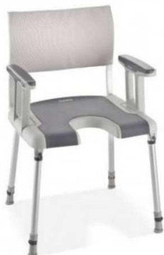
Chaise SORRENTO Haut 46 à 61 - 135 kg article 4875