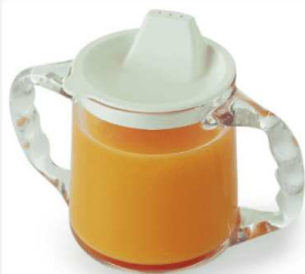
Gobelet deux anses avec couvercle compatible micro-onde article 1763