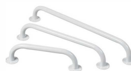
Barre d'appui Days Acier solide et durable Long 30-46-61-91 article 7649-7650-7651-7652