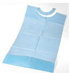
Bavoir plastifié bleu jetable 38x70 par sachet de 100 CIP 540762510 article 543