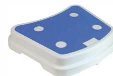
Marche pied de bain empilable Sky 45x35x10 article 9847