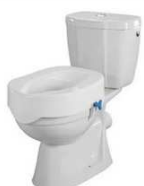
Réhausseur 10 cm sans couvercle article 9597 Avec couvercle article 9598 Souple sans couvercle article 1366 Avec couvercle article 1367