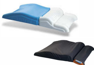
Talonnière double de fond de lit avec housse article 584