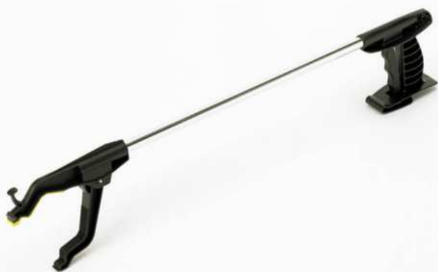
Pince préhension Handi-Reacher Longueur 61 cm Gachette ergonomique Aimant de récupération objets ferreux EAN : 5028318036059 article 1315