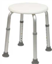
Tabouret assise ronde Haut 33 à 53 - Max 130 kg article 11133