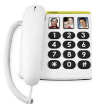
Téléphone DORO 331 13 numéros en mémoire 3 numéros directs avec photo garantie 2 ans article 8442