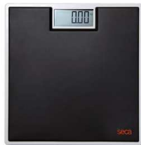
Pèse-personne électronique Seca 803 Noire article 11128