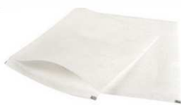
Gants de toilette Usage Unique sachet de 50 article 12598