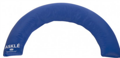
Cale de positionnement demi-lune (137 cm x 80 cm) article 222