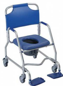
Chaise CASCADE Haut sol/assise 54.5 cm Freins à pousser Largeur assise 43 cm Largeur hors tout 64 cm Poids Max 120 kg article 1807