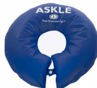
Plot circulaire (46 cm diamètre) article 2413