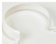
Rebord d'assiette Se clipse sur l'assiette diamètre de 23 à 28 cm article 10483