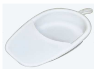
Bassin de lit article 369 Option couvercle article 368