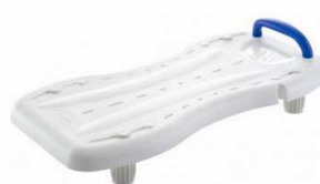
Planche de bain ergonomique Marina H12 Long 69 cm / poids max 150 kg article 368