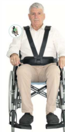
Ceinture éco de buste article 7628

Ces deux ceintures peuvent recevoir un module de maintien Pelvien (article 9664 - photos ci-dessous)