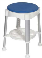
Tabouret rotatif TAHA Haut 41 à 58 - Max 135 kg article 9444