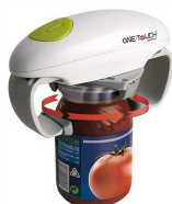
Ouvre bocal autonome article 4252