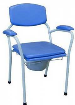
Chaise Garde-robe CANDY 155 Haut 45 cm - Largeur 46 cm accoudoirs fixes Poids 8 kg Finition Epoxy couleur article 2345