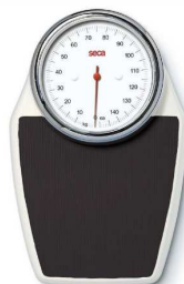
Pèse-personne mécanique Seca 760 article 11042