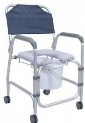
Chaise MAHINA Haut sol/assise 53 cm 2 roues arrières freinées Largeur assise 46 cm Largeur hors tout 55 cm Poids Max 136 kg article 9916